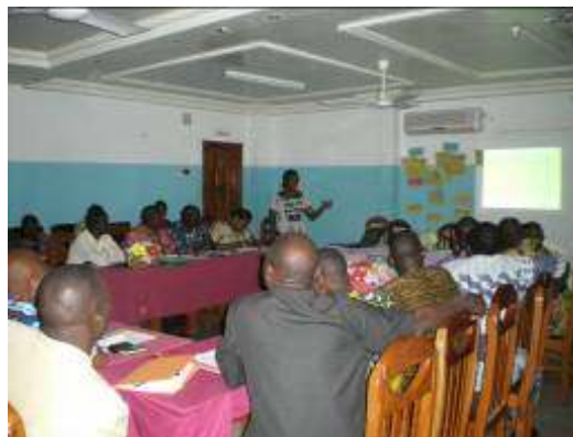
Photo 24 : Atelier de formation des CST et acteurs techniques des SIS

L'exécution du projet MYP en 2009 a permis au PNE-Bénin de contribuer au renforcement des compétences des CST, des cadres du CeCPA et des animateurs d'ONG d'inter médiation sociale des huit communes, lors d'une session organisée à Lokossa du 15 au 16 décembre 2009 (photo 24) sur la GIRE et la valorisation des ressources en eau.