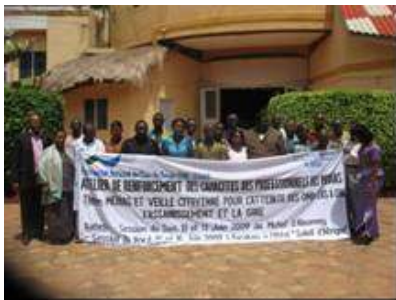
Photo 13 : les participants de la session d'Abomey

Le PNE-Bénin a également collaboré à l'organisation de la session de formation des communicateurs en élaboration de messages relatifs à la gestion durable du bassin du Niger, la GIRE, le cadre juridico-institutionnel et l'implication des médias » organisé par le Point Focal ABN -Bénin à Ouidah les 14-15 Octobre 2009.