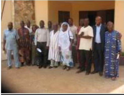
Photo 1 : Cellule de Coordination PF Borgou