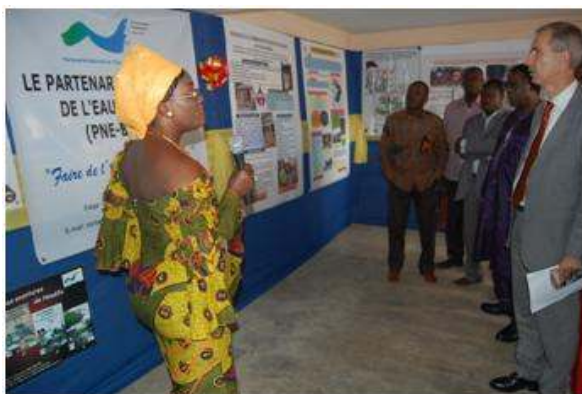
Visite du stand du PNE par les participants

La visite du stand du PNE-Bénin a révélé une fois encore l'intérêt des invités pour les différents supports réalisés par le PNE-Bénin. La participation du PNE-Bénin à cette journée porte a par ailleurs contribué à raffermir les liens de travail et de collaboration entre le PNE-Bénin et le CREPA-BENIN.