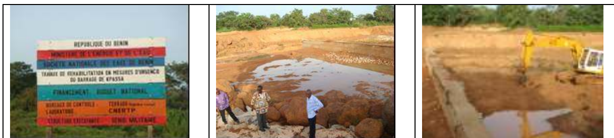
Photo 6, 7 & 8: La retenue d'eau de l'Okpara en cours de réhabilitation sur budget national en octobre 2009