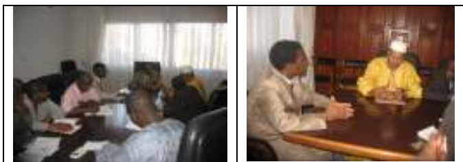
Photo 9 & 10 : Séances de plaidoyer en direction du MEPN et des membres de son cabinet

En plus des plaidoyers traditionnels vers le Ministre de l'Énergie et de l'Eau pour le suivi de proximité et l'accélération du processus de la GIRE au Bénin, le PNE-Bénin a tenu une séance de plaidoyer le 03 avril 2009, à l'endroit du Ministre de l'Environnement et de la