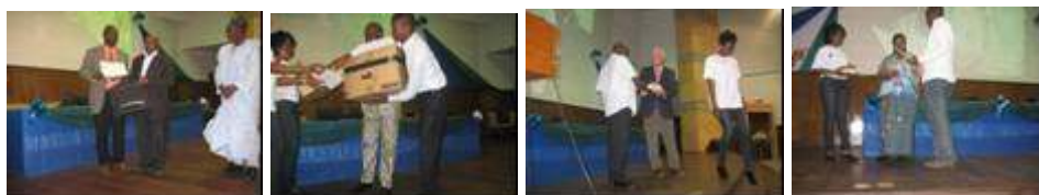
Photo 16 à 19 : Remise de prix aux lauréats du concours de médias sur l'eau, l'assainissement et la GIRE

L'année 2009 a été également marquée par la poursuite de l'expérimentation du processus d'intégration du manuel "l'eau, l'hygiène et la santé" dans les curricula des Cours