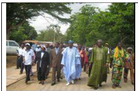
Photo 12 : La marche de sensibilisation des officiels de la Mairie au stade municipal d'Athiémé pour la célébration JME 2009

Le PNE-Bénin, en concertation avec les acteurs du secteur de l'eau au Bénin, a utilisé