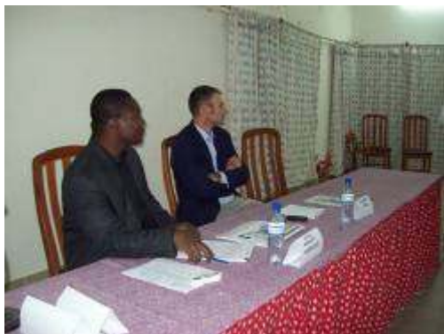
Photo 25 : Officiels à la cérémonie d'ouverture de la session de formation