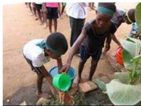
Photo 21 : Séance d'ablution après un cours d'éducation physique et sportive

En accompagnement au processus de promotion de la GIRE en milieu scolaire, le PNE-Bénin a réalisé un dessin animé à partir de la BD 3 qui sera multiplié en 3000 exemplaires, pour servir d'outils d'animation dans les écoles au cours de l'année scolaire 2009-2010. Dans le même cadre, les trois premiers numéros de la série des BD ont été multipliés en 1500 exemplaires de chaque, et le quatrième numéro édité en 2000 exemplaires.