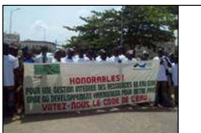
Photo 11 : La marche de plaidoyer et de sensibilisation des Députés à Porto Novo

Le 4 Mars 2009, le PNE-Bénin a appuyé techniquement et financièrement le Ministère de l'Énergie et de l'Eau (MEE) pour l'organisation d'un dîner de plaidoyer et de sensibilisation des Députés en faveur du vote du projet de loi sur l'eau et de la ratification de la convention 1997 des Nations Unies sur les cours d'eau transfrontaliers.