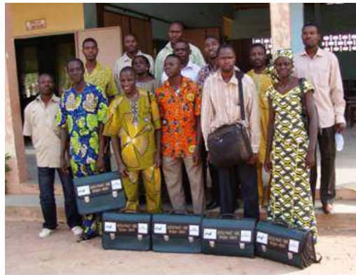
Photo 23 : Remise kit d'Outils PHAST-GIRE aux animateurs et agents des mairies dans le Borgou

Dans le Département du Borgou, il a été procédé à l'organisation d'un atelier de formation des structures d'intermédiation social et des communes (photo 23) les 25 et 26 novembre 2009 à Parakou sur l'utilisation des outils PHAST GIRE. A l'issue de la formation un kit de formation et un guide d'utilisation a été remis chaque structure et aux Autorités locales.