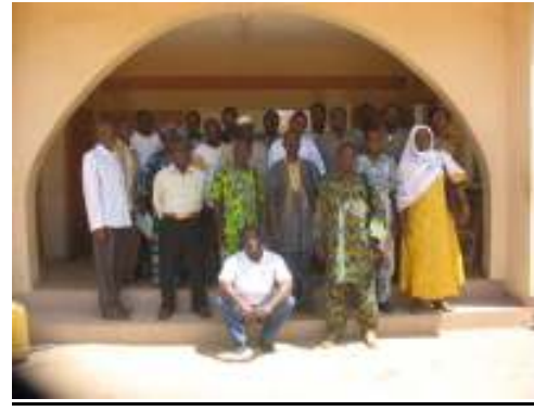
Photo 2 : Cellule de Coordination PF Alibori