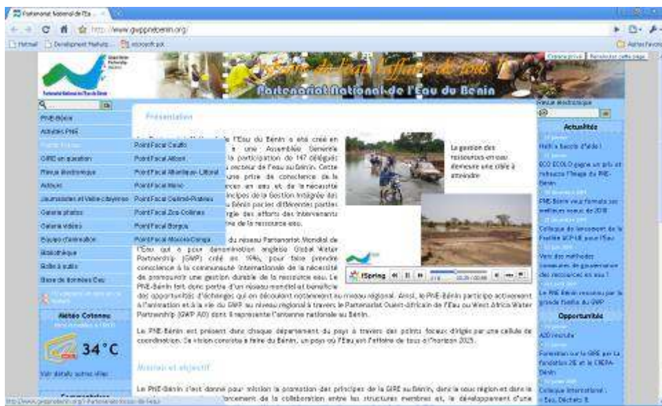
Illustration : Aperçu de la page d'accueil du site du PNE Bénin

A fin décembre 2009, le site a enregistré plus de 2.500 visites. Comme le montre le diagramme des statistiques de consultation, les 3 rubriques les plus consultées sont la "Galerie photos", la "Bibliothèque" et les "Opportunités". Ceci pourrait être un indicateur des attentes des visiteurs et acteurs du secteur de l'eau. A l'opposé, les rubriques "Galerie vidéos" et "Revue électronique" sont les moins visités. Ceci pourrait être la conséquence du peu d'information disponible dans ces rubriques.