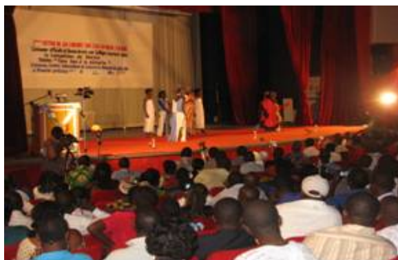
Photo 8 : Vue partielle du public dans la superbe salle Rouge du CIC à la soirée de remise de prix Le tableau 5 indique la répartition des prix.