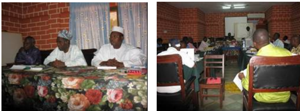
Photo 10 : mise en route de la session de formation à Porto-Novo le 13 décembre 2007

Les deux sessions de formation se sont déroulées du 13 au 15 décembre à Porto-Novo (Photo 10) et du 17 au 19 décembre 2007 à Parakou. L'objectif principal de cette formation est de mettre à la disposition des Chefs des Services Techniques une démarche et des outils pour soutenir l'administration communale dans l'élaboration et la mise en œuvre des instruments d'aménagement et de gestion de l'eau, en vue d'une gestion équitable et durable des ressources en eau à la base.