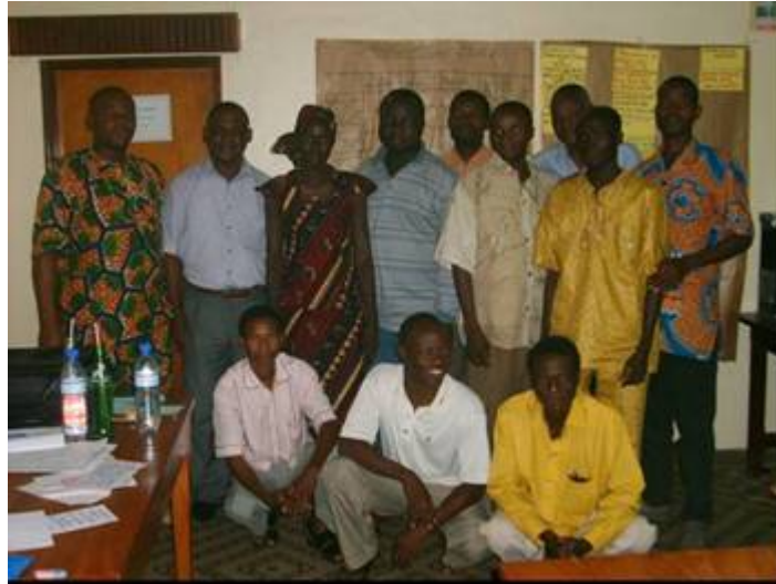
Photo 17 : les participants à la session de formation sur les gestions des conflits autour des ouvrages hydrauliques

Les différents modules de la session de formation ont permis aux participants de comprendre la notion de conflit lié à l'eau, de se familiariser avec les outils et méthodes de prévention et de gestion des conflits et de mettre en place un cadre d'application des connaissances acquises dans les villages d'intervention du PAGIREL Borgou-Alibori.