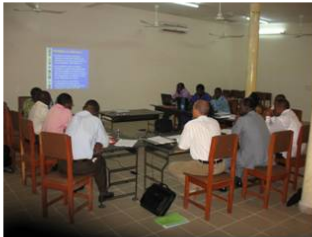
Photo 20 : les membres du CPLBB et les consultants à l'atelier de Grand Popo de novembre 2008