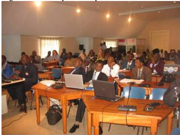
Photo 4 : Vue partielle des participants à la conférence régionale sur les changements climatiques