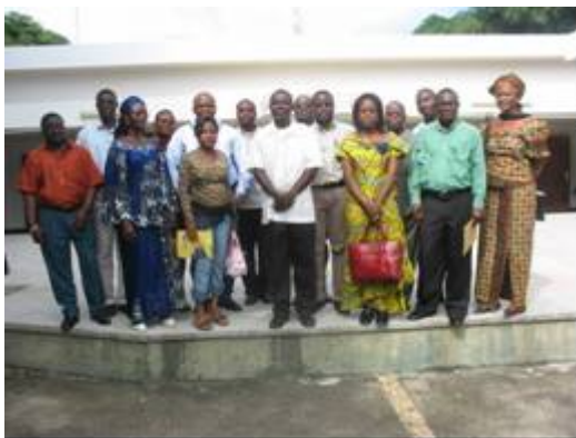
Photo 19 : les membres du Comité de Pilotage du Livre Bleu au Bénin