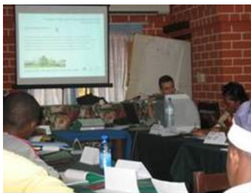
Photo 11 : présentation de l'expérience de ANTEA dans les collines