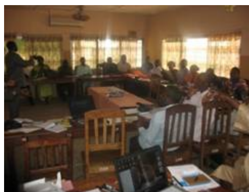
Photo 15 et 16 : les membres du RJBEA du Sud-Bénin à la session de formation de décembre 2007