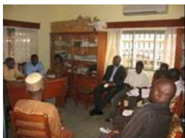
Photo 2 : les officiels à l'ouverture de l'atelier

La campagne de sensibilisation sur la protection du champ de captage de Godomey a permis d'informer et de sensibiliser les élus locaux de la commune d'Abomey-Calavi et les autres acteurs impliqués dans l'approvisionnement en eau potable, sur les problèmes de pollution des aquifères du plateau de Godomey. Elle a également mis l'accent sur les risques qui menacent à terme l'approvisionnement en eau potable en milieu. L'implication des hommes médias dans la conduite de la campagne a permis de toucher un public plus large à travers des émissions (radio et télé) ainsi que des articles publiés dans la presse écrite traitant de la pollution des aquifères et des risques y afférents sur l'approvisionnement en eau potable en milieu.