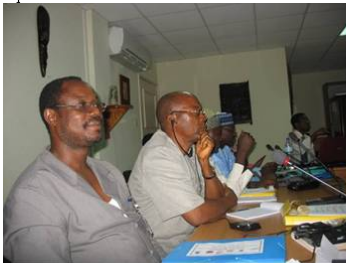
Photo 3 : Vue partielle des participants à l'atelier régional sur les aquifères transfrontaliers