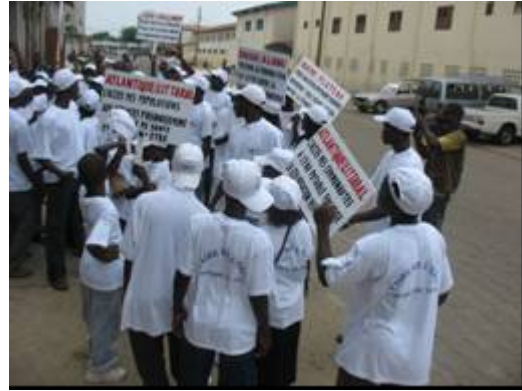
Photo 5 et 6 : Caravane de sensibilisation sur le thème de la Journée Mondiale de l'Eau du 22 mars 2007

Le PNE-Bénin a mis en place pour les élèves des troupes départementales un cadre de regroupement, d'apprentissage et d'échanges dont les classes de l'eau, à travers :