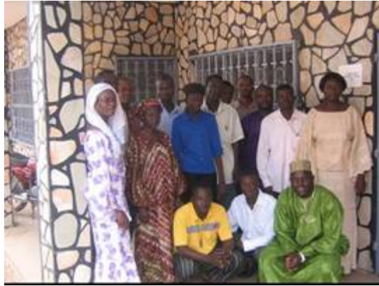
Photo 18 : les participants à la formation de novembre-décembre 2007

La session de formation fait suite au processus d'élaboration du guide PHAST/ GIRE élaboré en concertation avec les acteurs du secteur de l'eau de l'Atacora et de la Donga de décembre 2006 à juin 2007 pour promouvoir la compréhension et la mise en œuvre de la GIRE par les communautés à la base dans les deux départements.