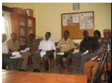
Photo 1 : Conférence de presse sur la pollution des aquifères en milieu urbain

L'Atelier de sensibilisation des élus locaux de la Commune d'Abomey-Calavi, s'est déroulé le mardi 30 janvier 2007 dans la salle de conférence de la mairie de ladite commune (Photo2).