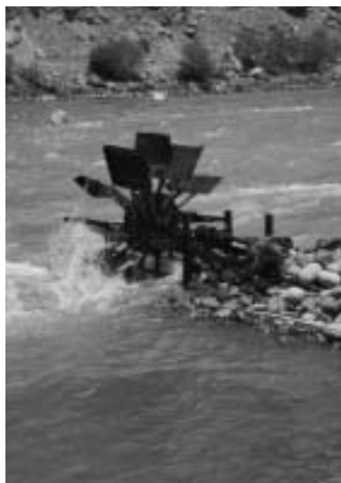
Illustration sur la page de titre : L'utilisation de technologies appropriées et une gestion de l'eau au niveau local sont des principes-clé de la « Gestion Intégrée des Ressources en Eau ». Cette turbine hydro-électrique artisanale, qui apporte la lumière électrique à un ménage à Bassid, Vallée de Bartang au Tadjikistan, montre comment l'eau – une ressource naturelle renouvelable – peut être utilisée de manière durable.